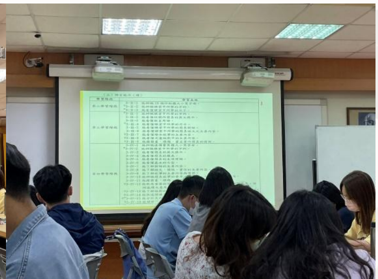
▲講師講解英語文活動