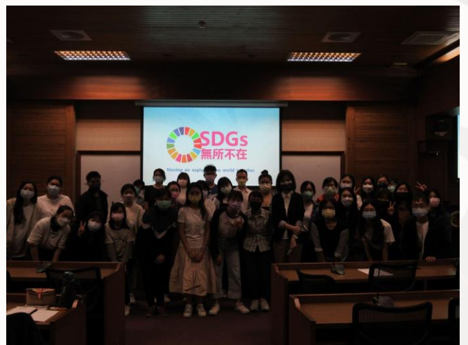
▲同學們對今日所學踴躍地發表意見 ▲SDGs無所不在研習大合照