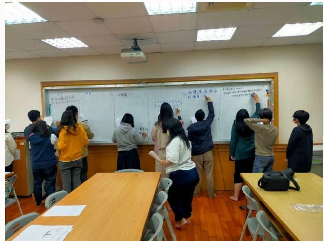
▲各組寫下討論出的觀點