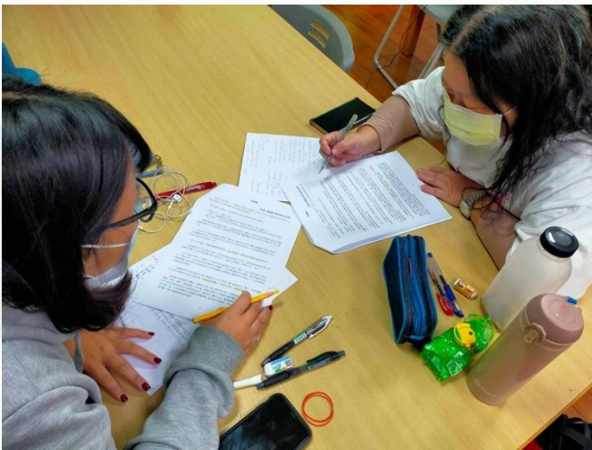
▲同學討論情意寫作的過程