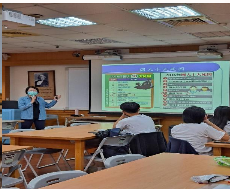
▲老師講述如何以血色判斷生命跡象及國人十大死因