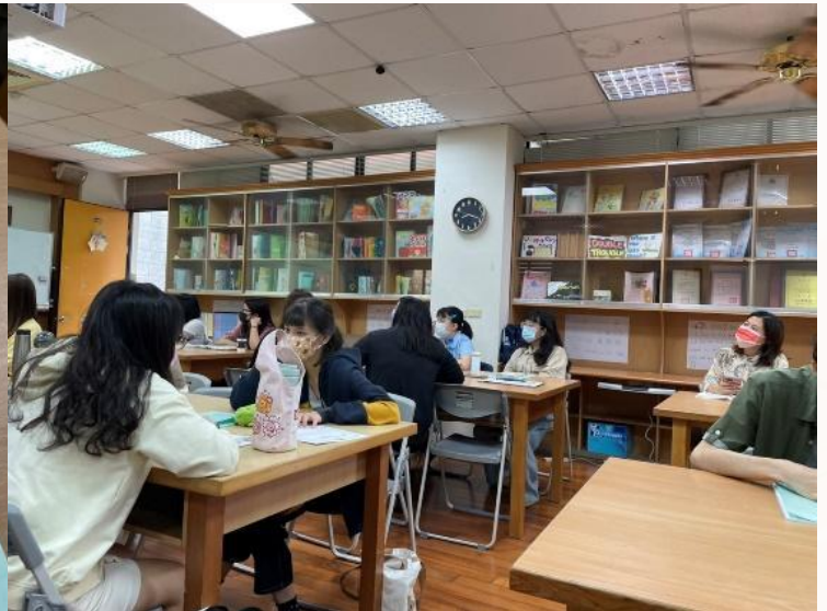
▲師資培育生們認真聽講