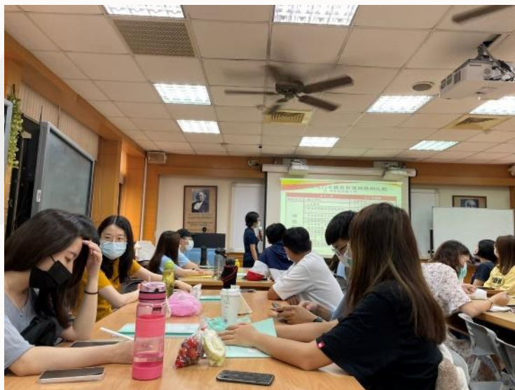
▲師資培育生們討論活動內容