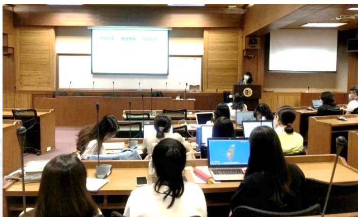
講師重點整理做為總結