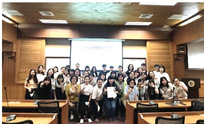
講師與同學們大合照