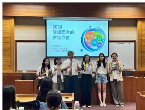
◆與會師生及 蔡清華 政務次長大合照