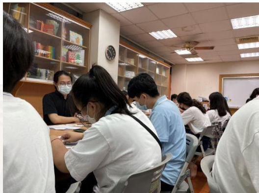
◆同學練習書寫板書