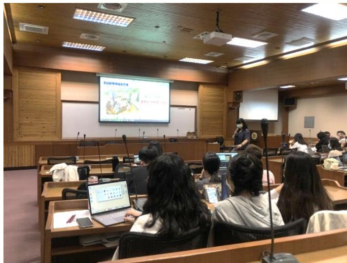
體驗學生使用的教室功能