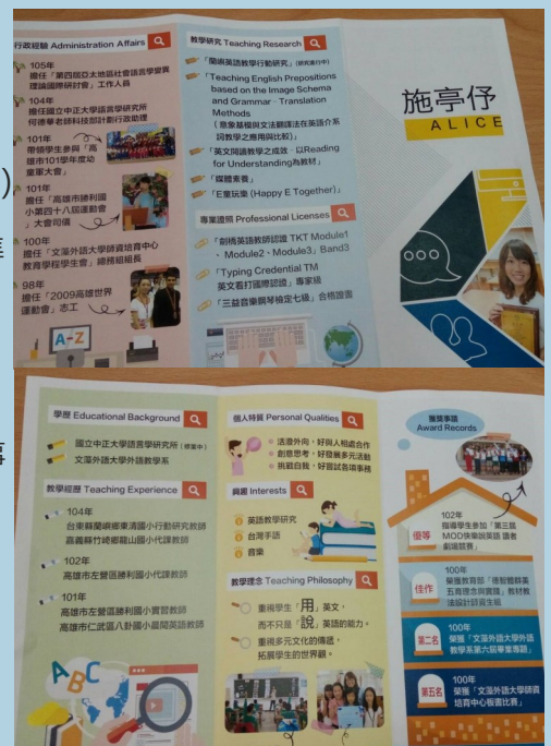
學姐學經歷三折頁分享