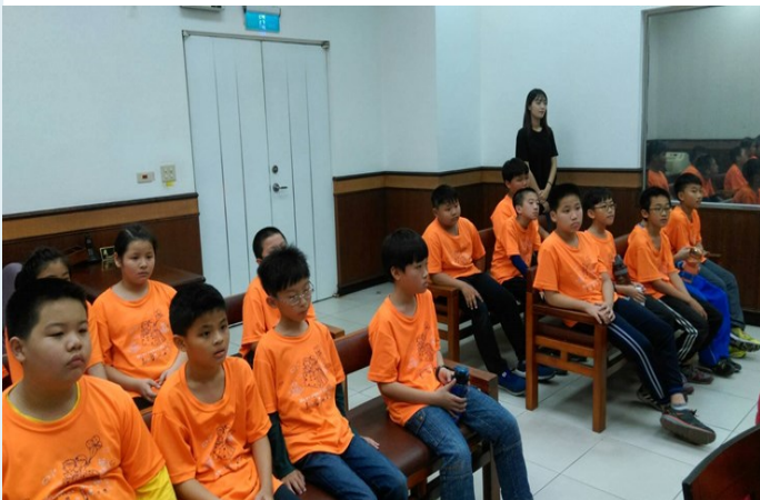
少年法院參訪(行政實習)