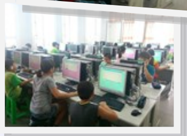
協助補救教學篩選測驗